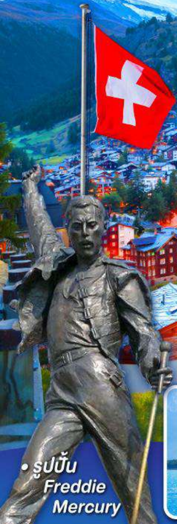
• รูปปั้น Freddie Mercury

พีชิต 5 เวก์ริก, เวก์ฮาร์ดคอร์คัม, เวก์จุงเฟรรา เวก์กลาเซียร์ 3000 และ เวก์กรอนเนือร์แกรต