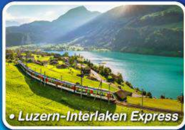
• Luzern-Interlaken Express