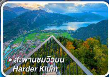
• สะพานชมวิวนบน Harder Klum